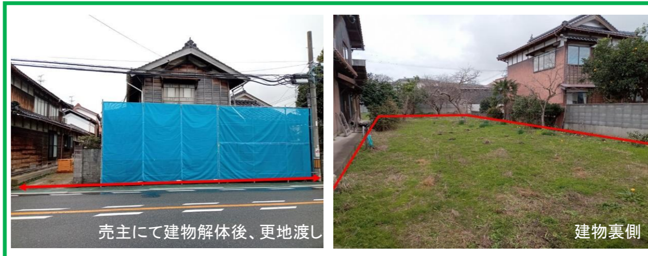
売主にて建物解体後、更地渡し