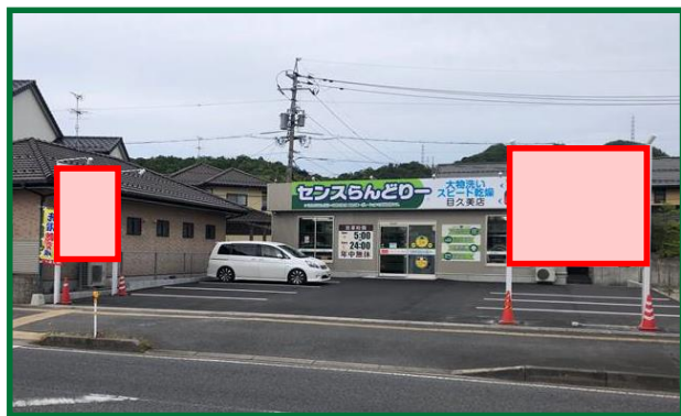
平安祭典 米子中央会館