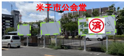
←大山方面 境港方面→