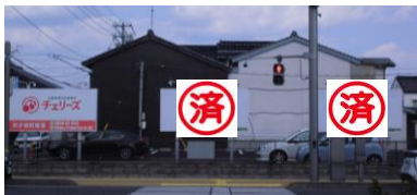
←境港方面 大山方面→