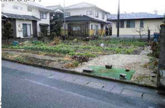
2016年2月中旬頃の様子