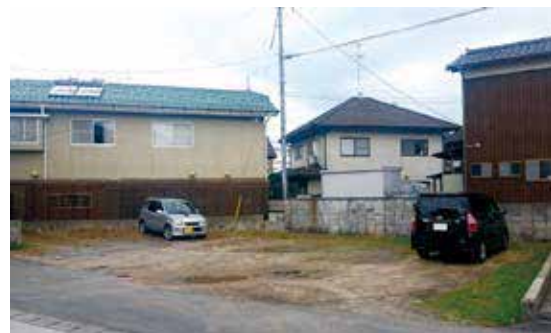
2015年12月上旬頃の様子