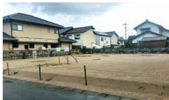
2015年12月中旬頃の様子