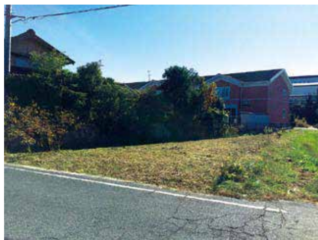
2015年11月上旬頃の様子